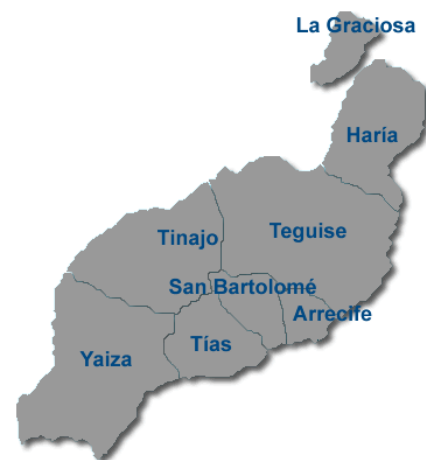
Mapa de Lanzarote

Hemos olvidado que lo importante somos nosotros, los residentes, y nuestra calidad de vida.